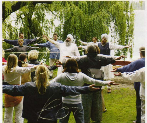
Hier atmen sogar die Füße: „Breathwalking“ – asiatische Wellness auf der Hamburger Alsterwiese